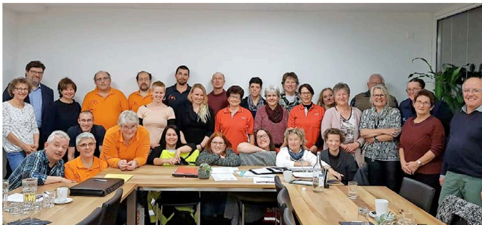
Die Mitglieder des Samaritervereins Thuisis an der letzten Generalversammlung.